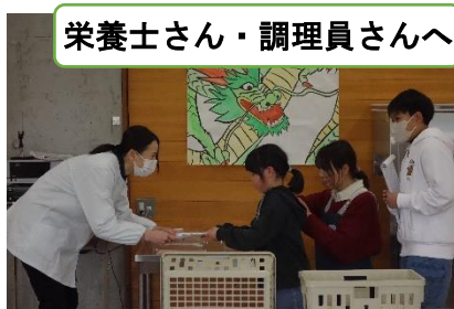
栄養士さん・調理員さんへ