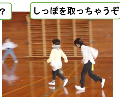
しっぽを取っちゃうぞ