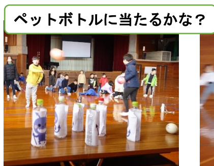
ペットボトルに当たるかな?