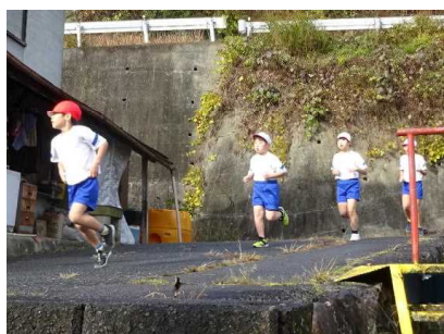
下り坂はスピードに乗ります