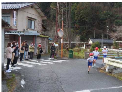
多くの方の応援がパワーに