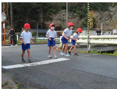
1・2年生、元気いっぱいスタート！

児童の安全のために、監視をしながら応援してくださった保護者及び学校支援ボランティアの皆様、温かい声援をくださった地域の皆様、ありがとうございました。