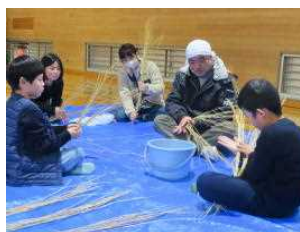
習う方も真剣です