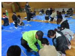
熱心に教えてくださいました