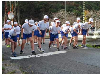
5・6年生の力強いスタートです