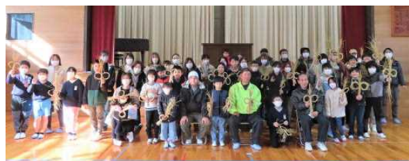
完成したお飾りを手に全員で記念撮影