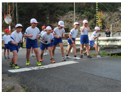
3・4年生も気合い十分です