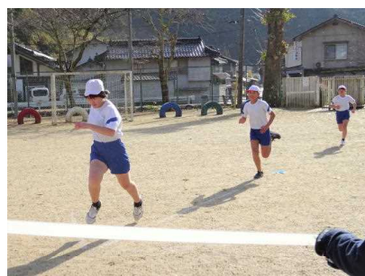
ゴール前のデッドヒート