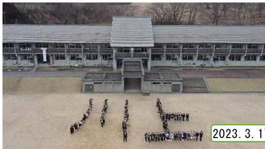
2023. 3. 17 撮影