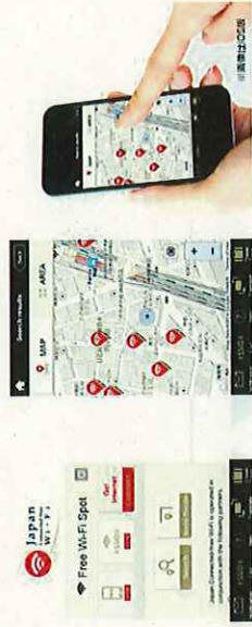
Japan Connected-free Wi-Fi 画面イメージ