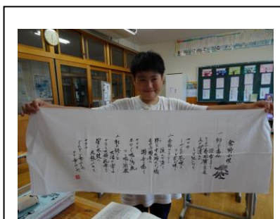
5・6年。総合学習。余野小唄 の歴史を探る。