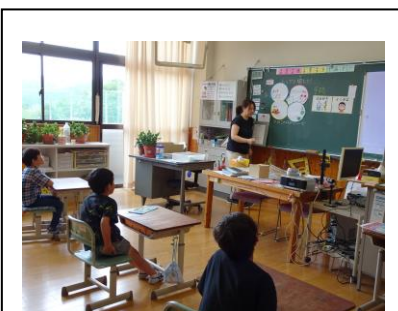
3・4年。歯の健康指導。ガム とアプリで“噛む力”を測定。