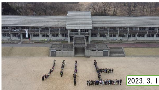
2023. 3. 17 撮影