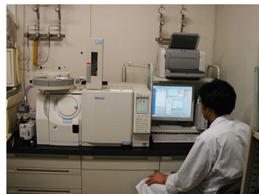
GC/MSによる農薬等類の測定