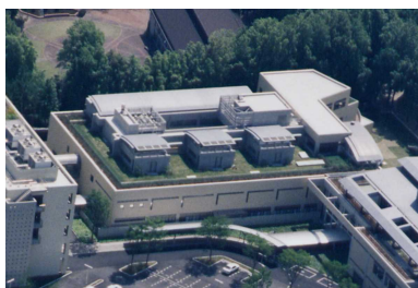
委託水質検査機関：(公財)岡山県健康づくり財団

もに外部が行う精度管理の評価試験を受けさせ、その結果が「不満足」又は「質疑あり」とされるZ値の絶対値が2を超えないよう、精度のよい測定を行わせるなど信頼性の保証に努めています。