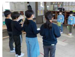
お迎えのあいさつ

優しく声をかけながらリードする1・2年生の姿からは、先輩としての頼もしさを感じられました。小学校で一緒に勉強できる日が楽しみです！