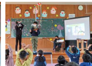
6年生からのお礼のクイズ