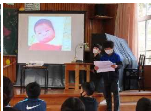
誰の赤ちゃんの頃かな？