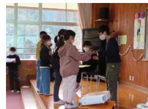
在校生からのプレゼント