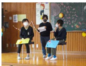
6年生にインタビュー