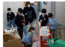
1・2年生手作りの迷路