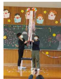
くす玉からメッセージ

この会の内容を全校会議で話し合い、1年生から5年生がいろいろな役割を分担して準備してきました。6年生にとっては、小学校生活のよい思い出の一つになり、1～5年生にとっては、会を成功させたことが大きな自信となったことでしょう。4月からの新学年での活躍が楽しみです。