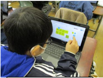
3年 友達はどうな 考えかな？

3年生は、タブレットのひとつの画面上に、各自の意見を貼り付けて、考えを交流しあう学習を行いました。効率的にお互いの考えを確認し合うことができました。4年生は、体育の学習で、リズムなわとびを跳んでいるところを友達にタブレットで録画してもらい、その動画をもとに技をより工夫していく活動に使いました。5年生は、プログラミングボールを使用し、スタートからゴールまでコースを書いた紙の上を、ボールが順序よく進むようにプログラミングする学習を行いました。自分たちが設定した通りにボールが進んでいくのをうれしそうに見ていました。6年生は、人感センサーが感知すると、自分たちの録音した声が出るプログラミングをする学習を行いました。学習を通して、実際の生活の中で使用されている人感センサーの仕組みが分かりました。