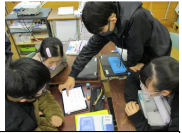
6年 プログラムした通りに 人感センサーが動くかな？