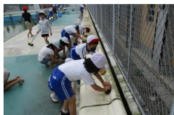
2年生 プールサイド掃除