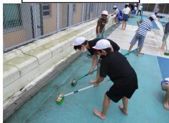
4年生 プールサイド・側溝掃除