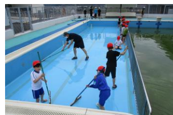
3年生 小プール掃除