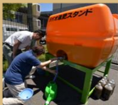
実証事業でできたバイオ液肥は無料配布