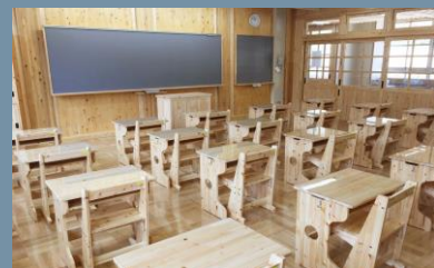
真庭産材をふんだんに活用した小学校