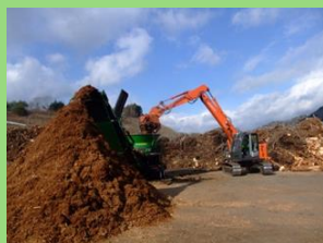
地域の未利用材等が集まる真庭バイオマス集積基地