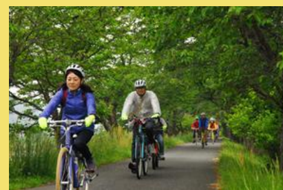
自転車のまちづくり (真庭市各地で散走イベント実施)

散走(散歩するようにゆっくりと歴史や文化、食に触れる楽しみ方)に取り組むとともに、大学等との連携により、健康づくりにも活用