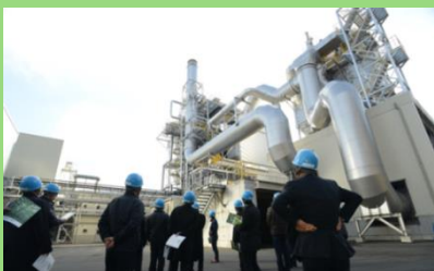
2015年から順調に稼働している真庭バイオマス発電所

今まで廃棄物として扱われていた未利用木材などの「木質バイオマス資源」を活用して再生可能エネルギーを生み出すとともに、新たな雇用も創出