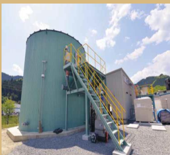
メタン発酵実証プラント