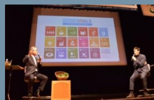
市長と伊勢谷友介氏との対談 SDGs未来社市フォーラム('19年3月)