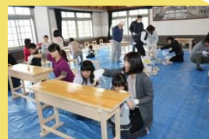
国指定重要文化財(旧遷喬尋常小学校)の備品づくりワークショップ

散走(散歩するようにゆっくりと歴史や文化、食に触れる楽しみ方)に取り組むとともに、大学等との連携により、健康づくりにも活用