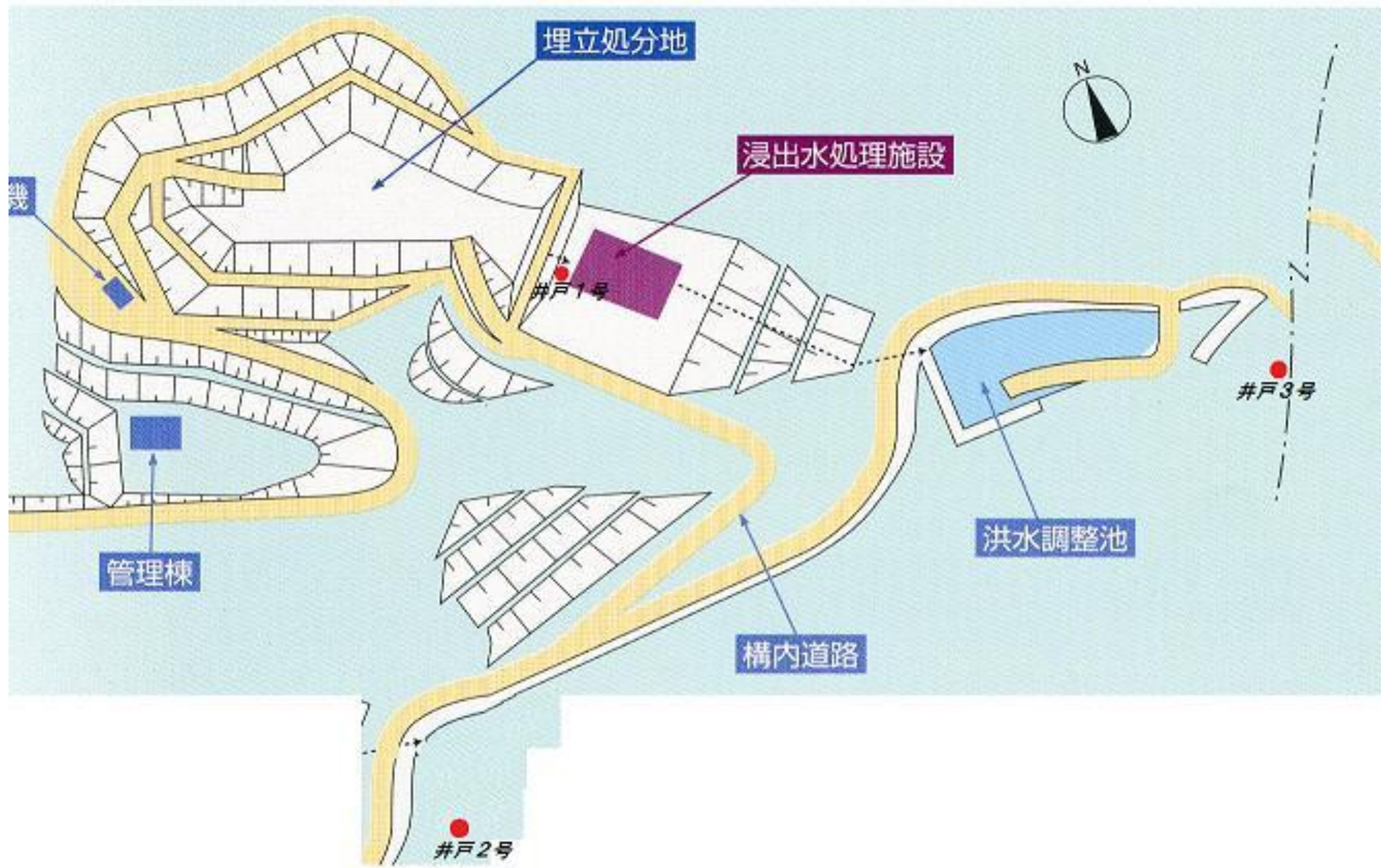
モニタリング採水位置図