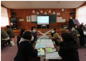
みらい会議の様子

続いて行われた「第1回富原っ子みらい会議」では、「話してみよう!富原の子どものこと」の議題で、保護者の方同士の意見交流を行いました。富原の子どもたちのよいところや課題、どんな子に育ててほしいかについて、和やかな雰囲気の中で、活発に意見が交わされました。今後、子どもたちの成長に向けて、学校と保護者ともに力を合わせて取り組んでいくための第一歩として、とても有意義な時間となりました。