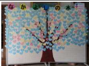
人権週間の取組「なかよしの木」