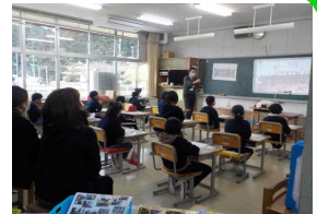
3・4年生の授業の様子

1月22日(土)の人権参観日には、お忙しい中おいでいただき、ありがとうございました。新型コロナウイルス感染症が心配される中ででしたが、予定通り実施することができました。