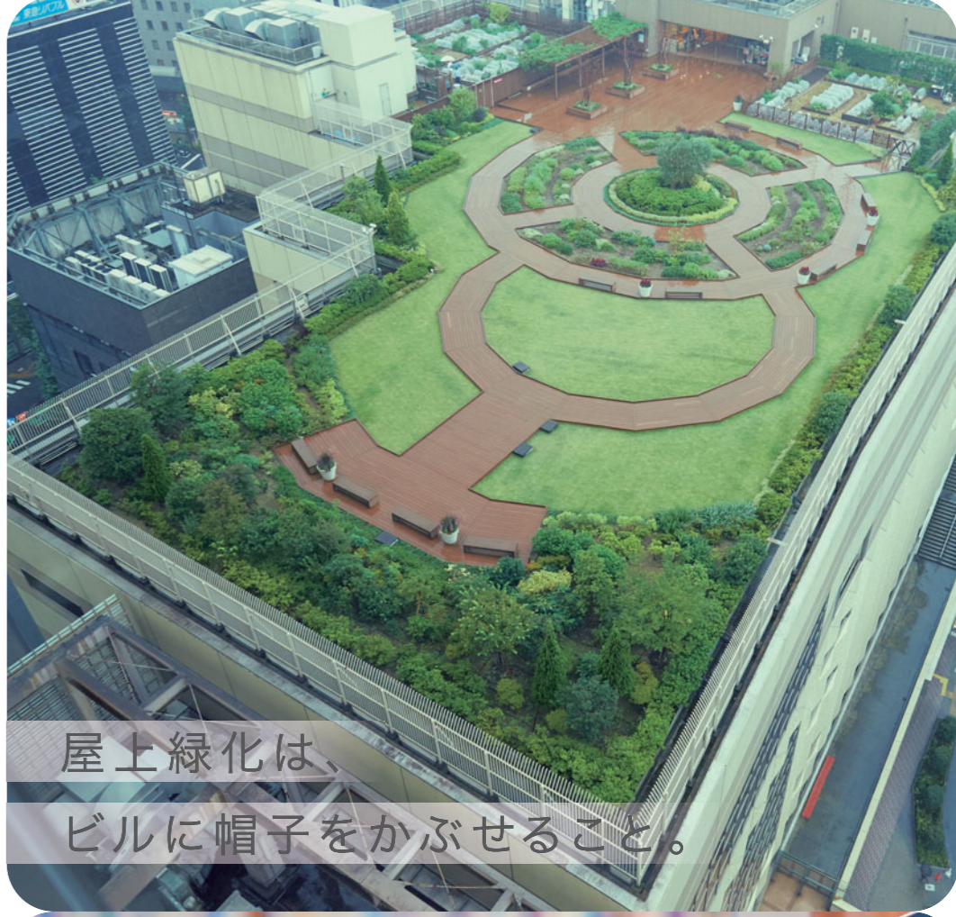
屋上緑化は、ビルに帽子をかぶせること。