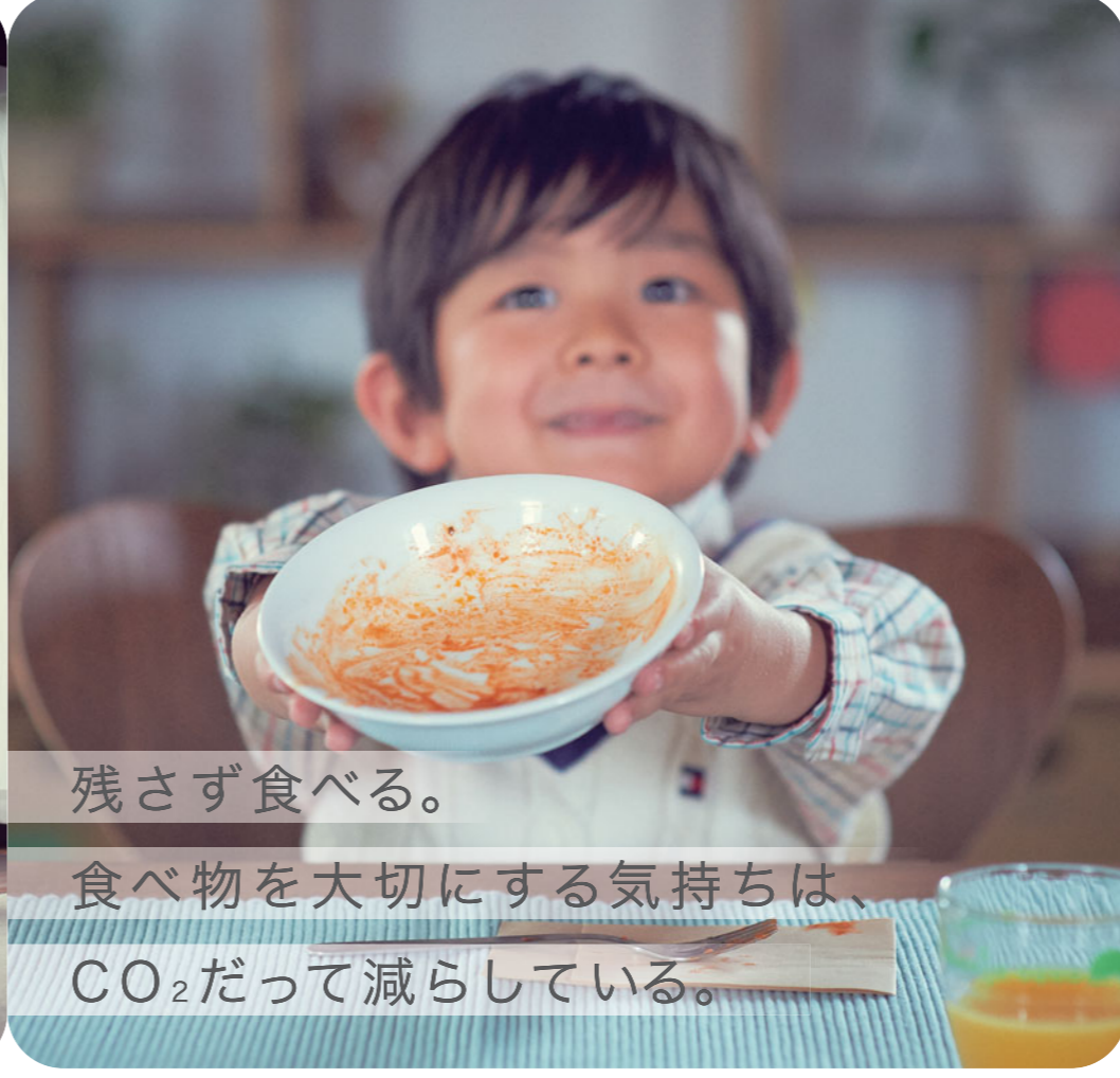
残さず食べる。食べ物を大切にする気持ちは、CO 2 だって減らしている。