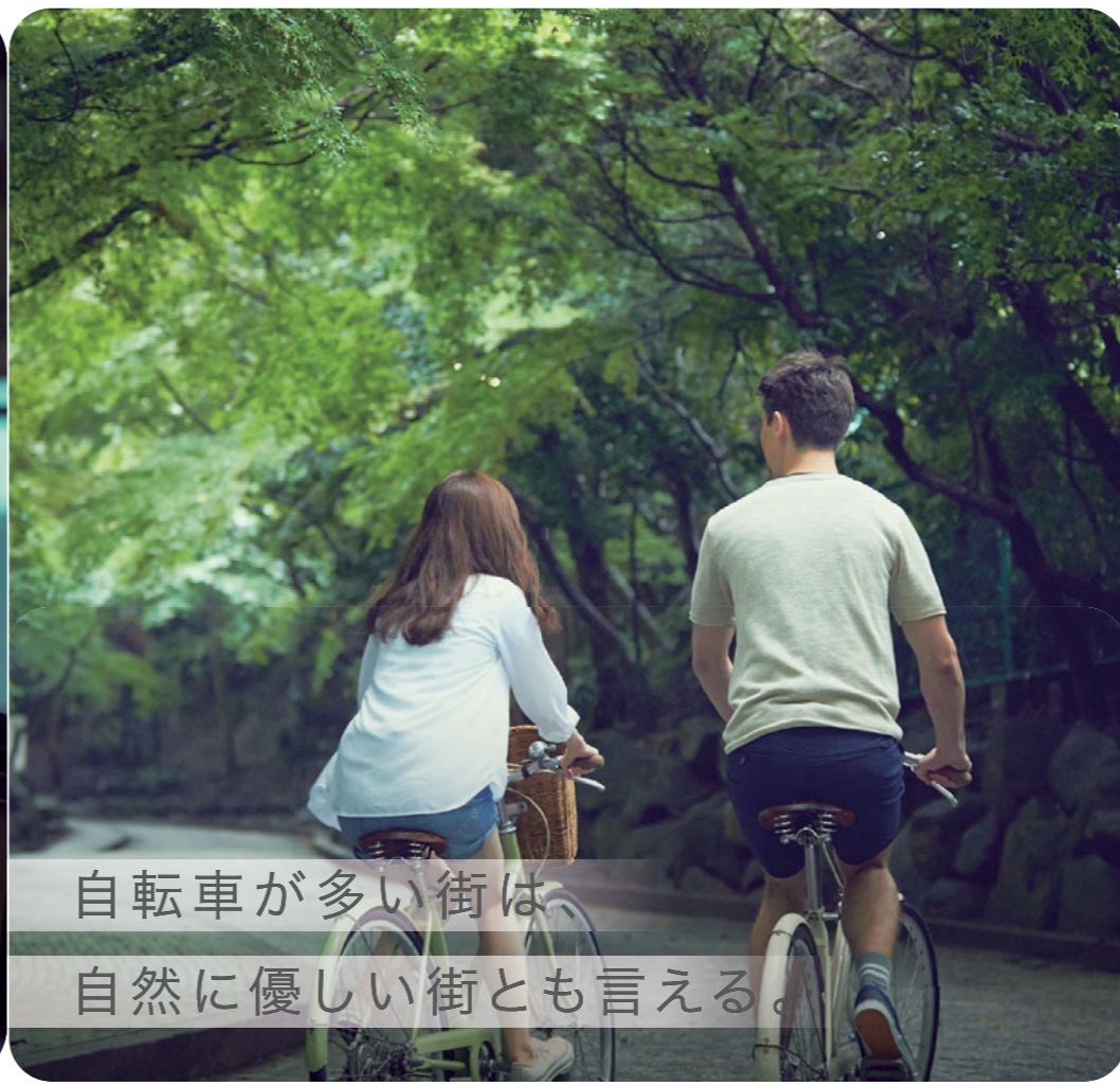
自転車が多い街は、自然に優しい街とも言える。