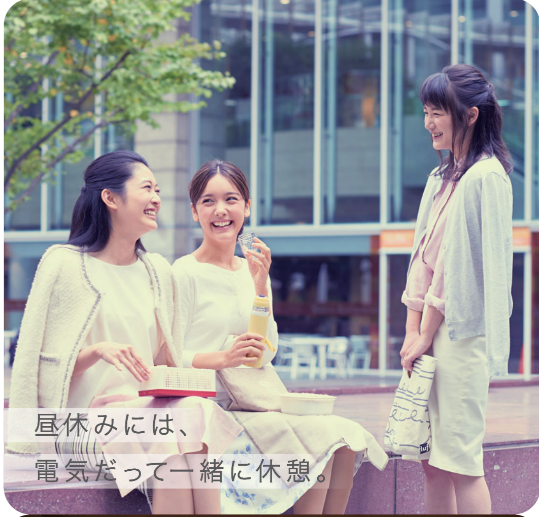
昼休みには、電気だって一緒に休憩。