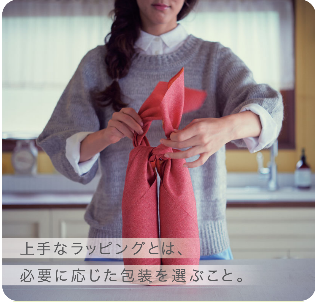
上手なラッピングとは、必要に応じた包装を選ぶこと。