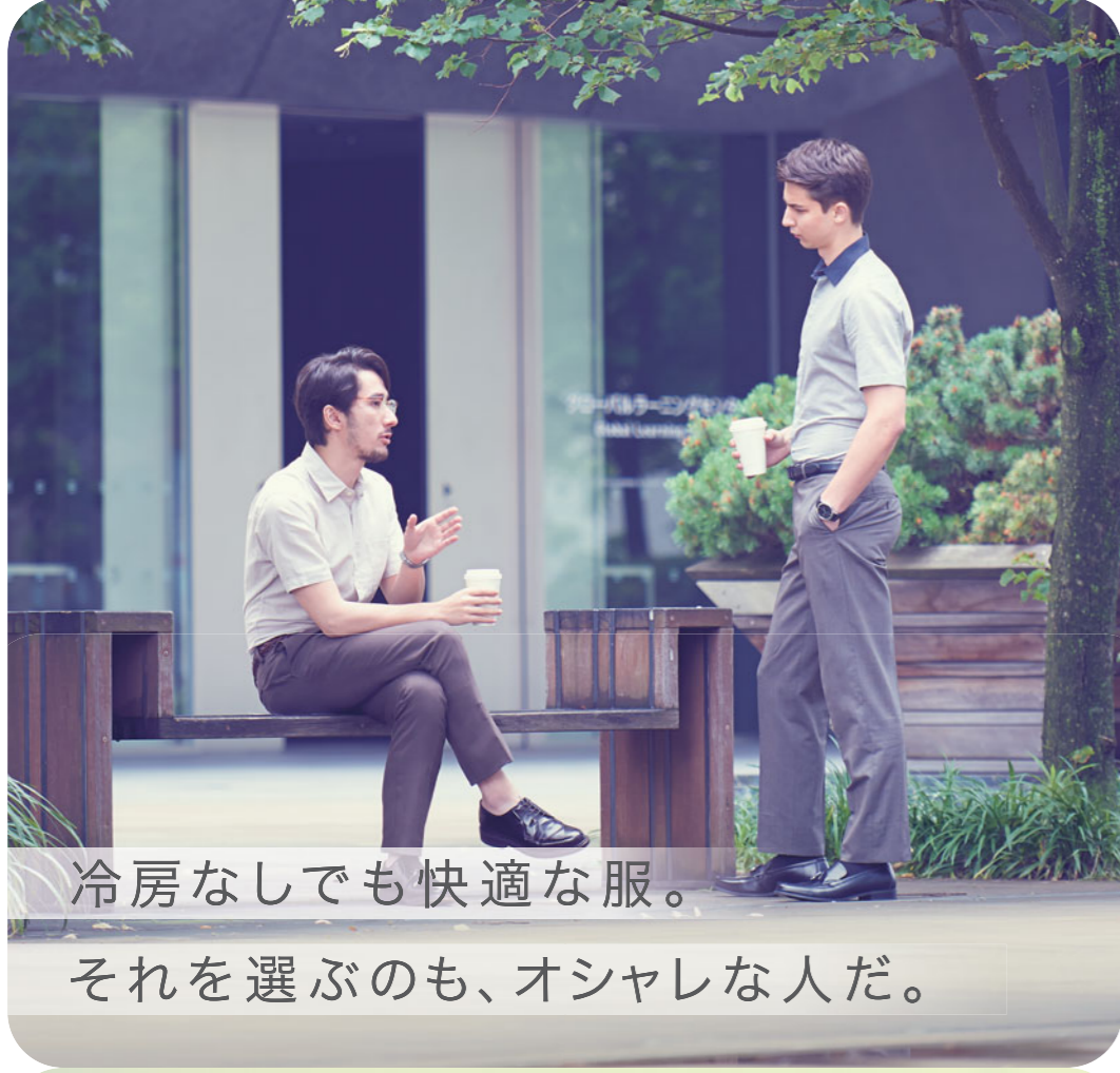
冷房なしでも快適な服。それを選ぶのも、オシャレな人だ。