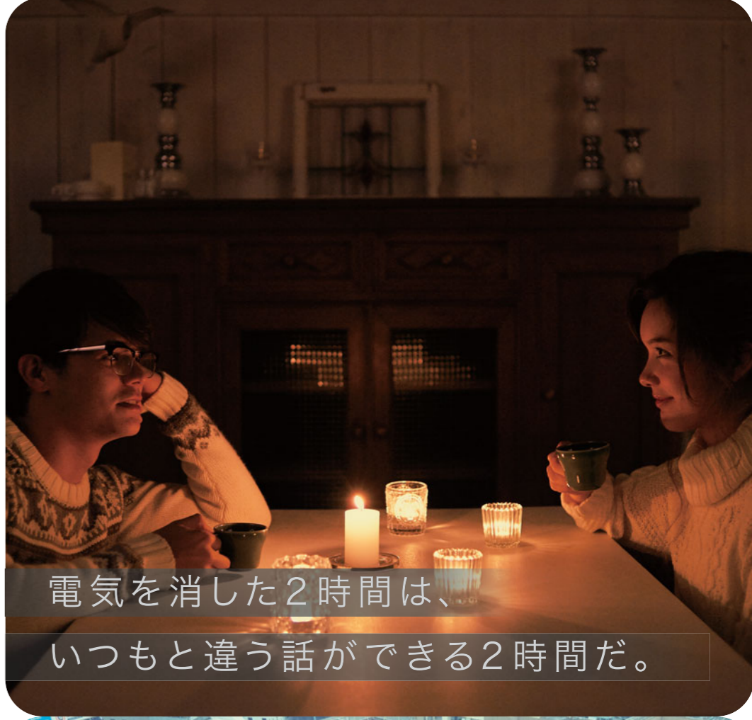
電気を消した2時間は、いつもと違う話ができる2時間だ。