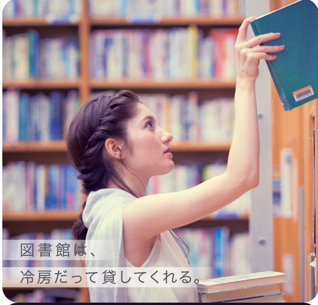
図書館は、冷房だって貸してくれる。