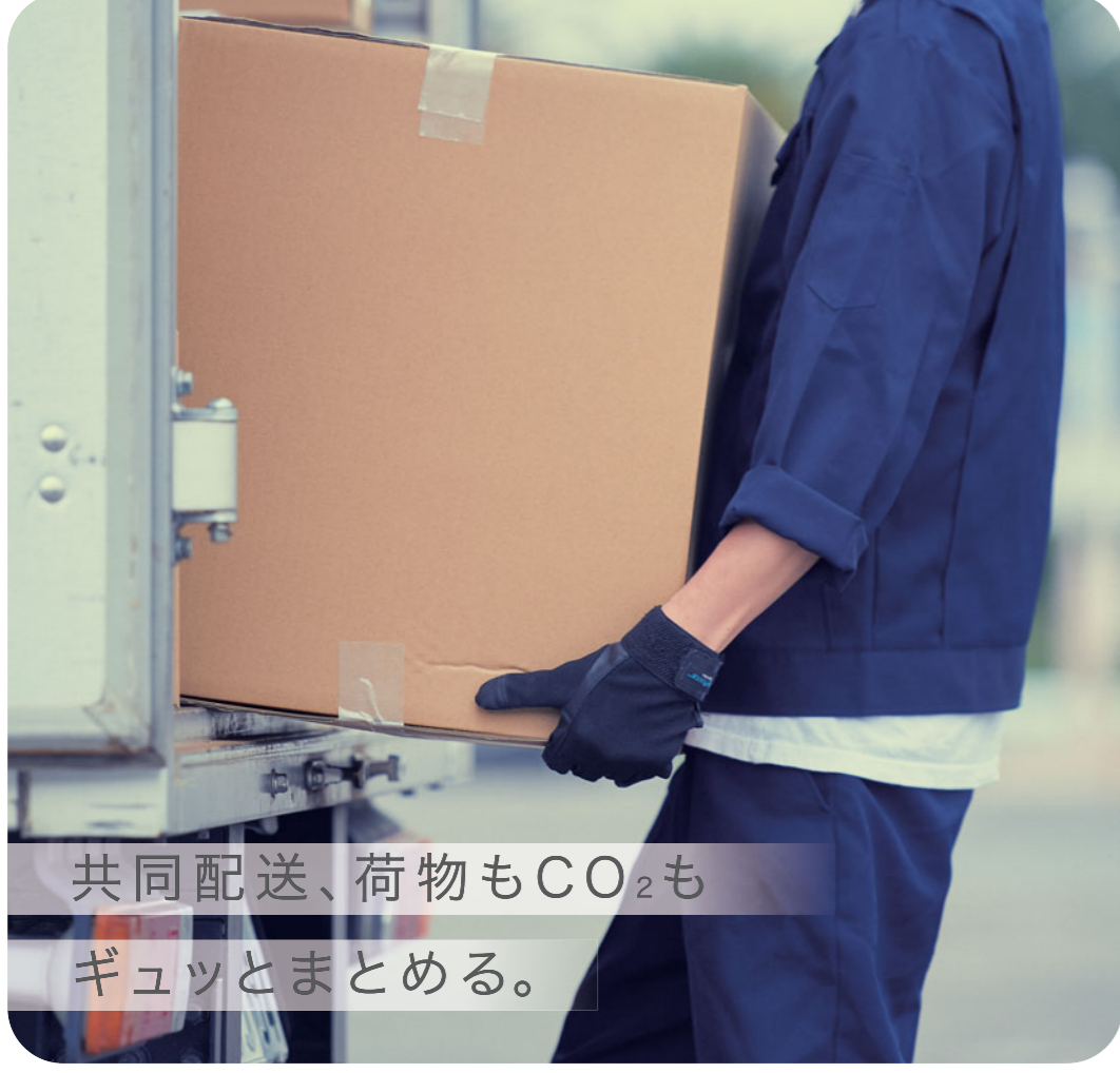
共同配送、荷物もCO 2 もギュッとまとめる。