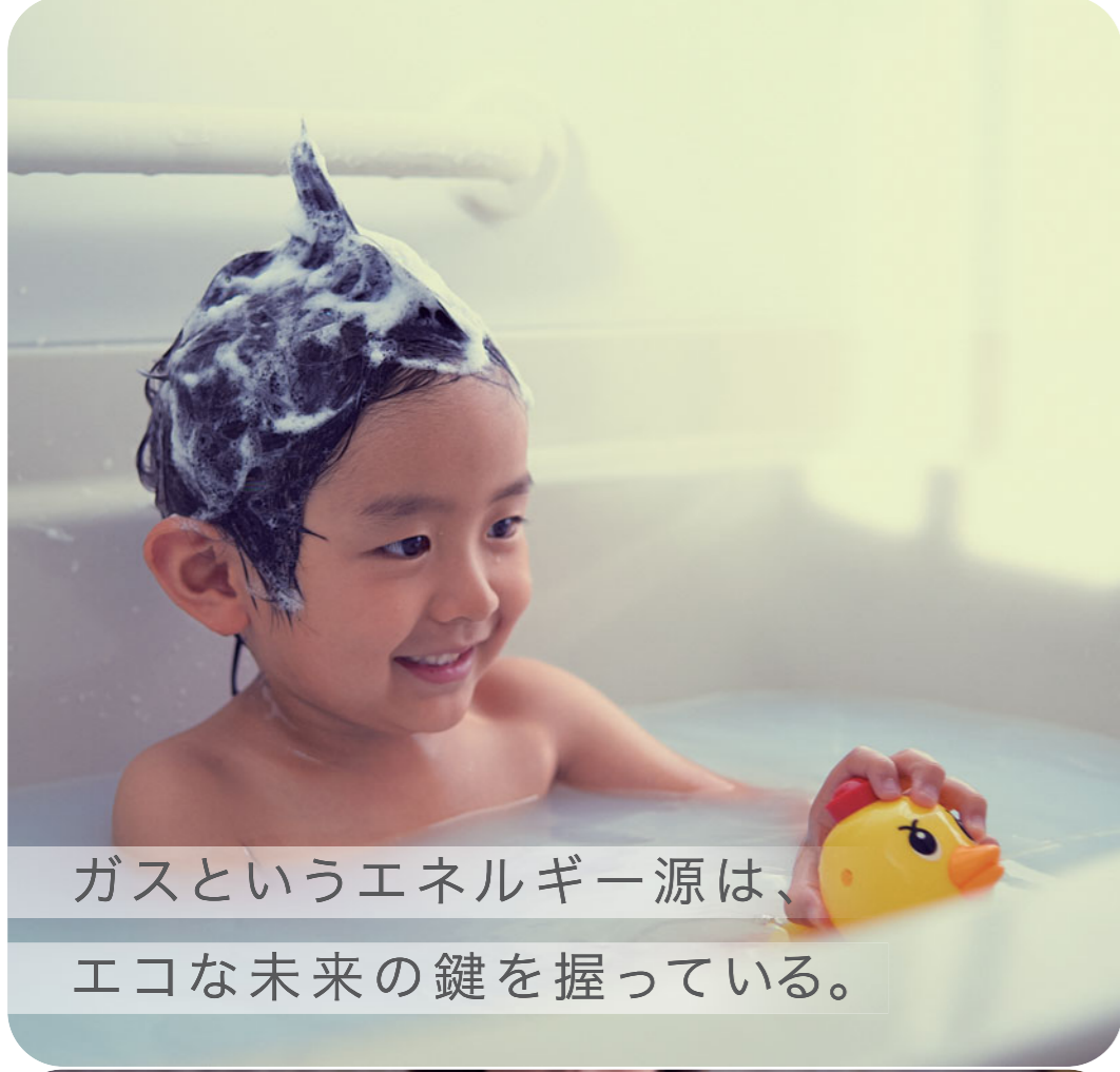
ガスというエネルギー源は、エコな未来の鍵を握っている。