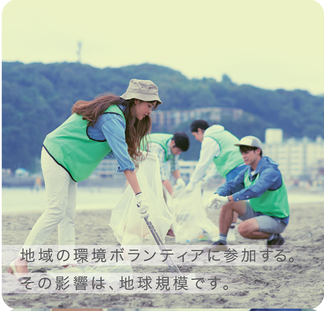
地域の環境ボランティアに参加する。その影響は、地球規模です。