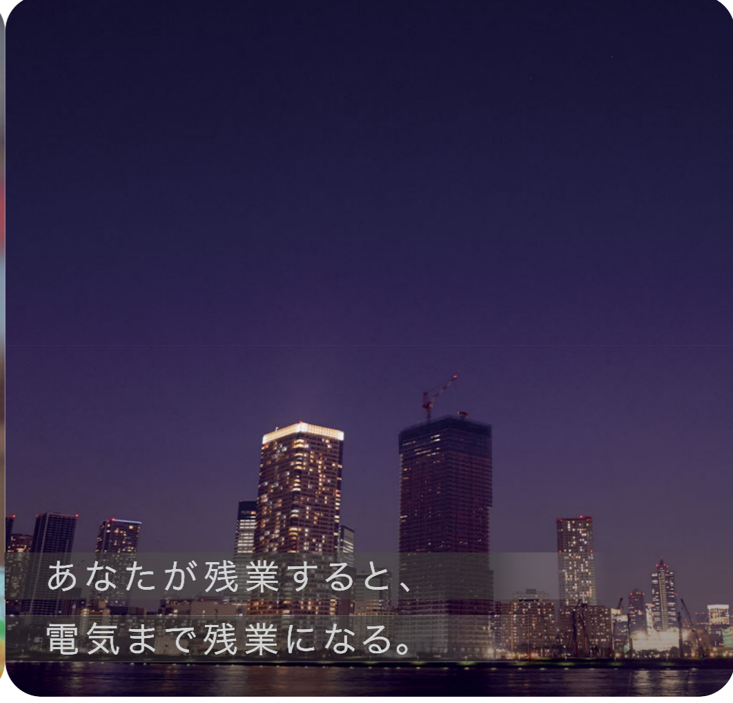
あなたが残業すると、電気まで残業になる。