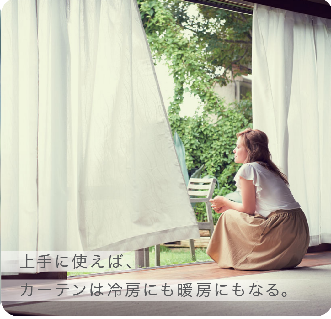
上手に使えば、カーテンは冷房にも暖房にもなる。