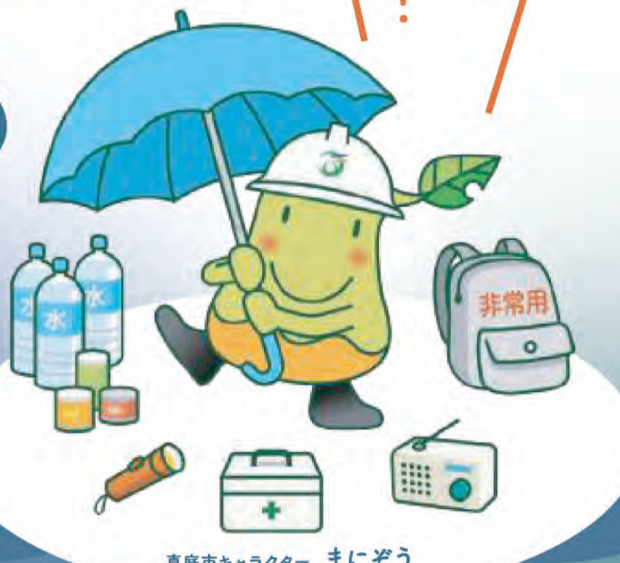
真庭市キャラクター まにぞう