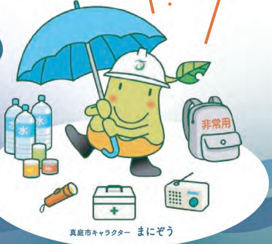
真庭市キャラクター まにぞう