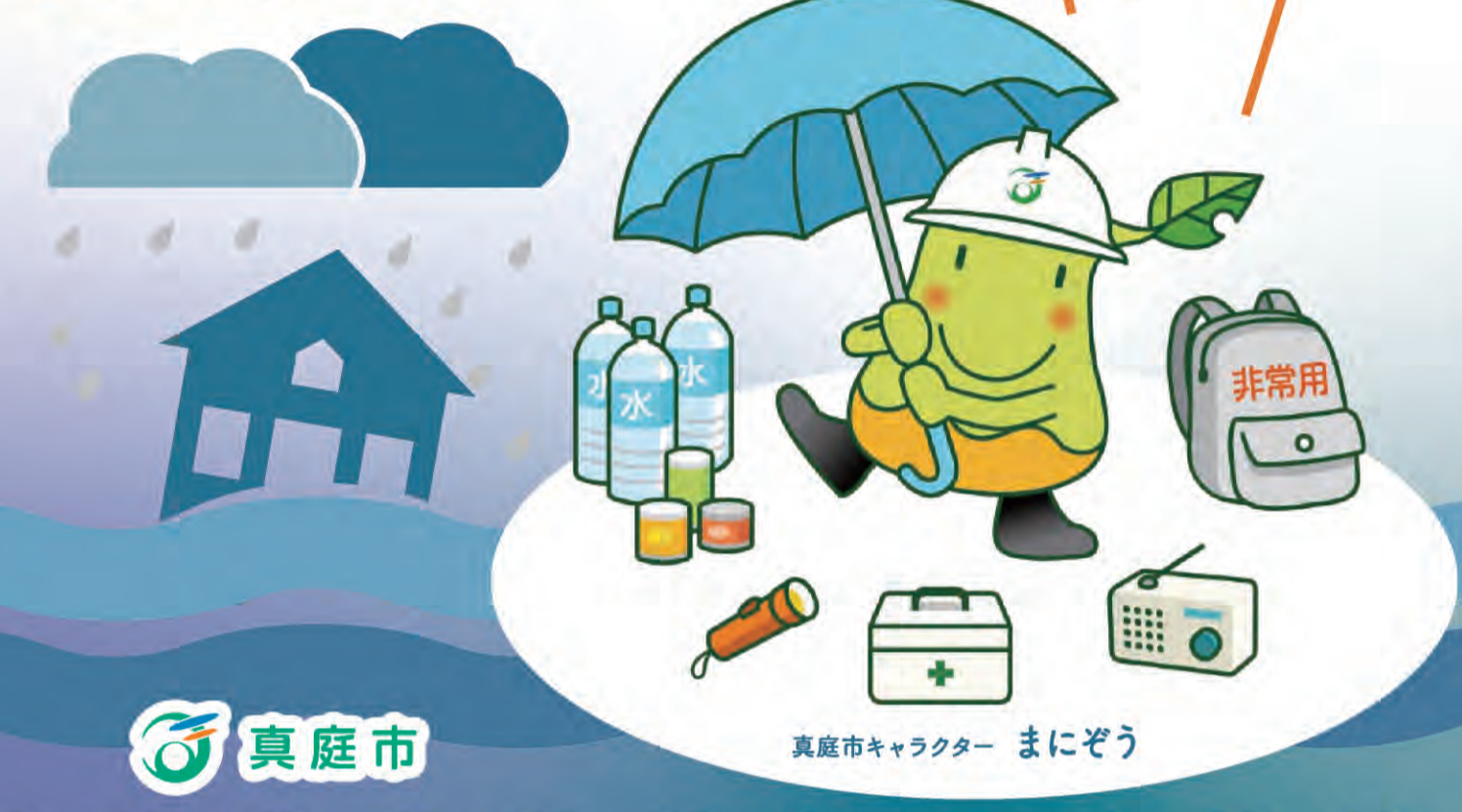
真庭市キャラクター まにぞう

災害はいつ起こるかわかりません。もしものとき、家族や自分の命を守るために日ごろから避難経路を確認したり、防災グッズを準備しておきましょう。