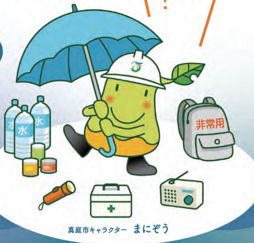
真庭市キャラクター まにぞう