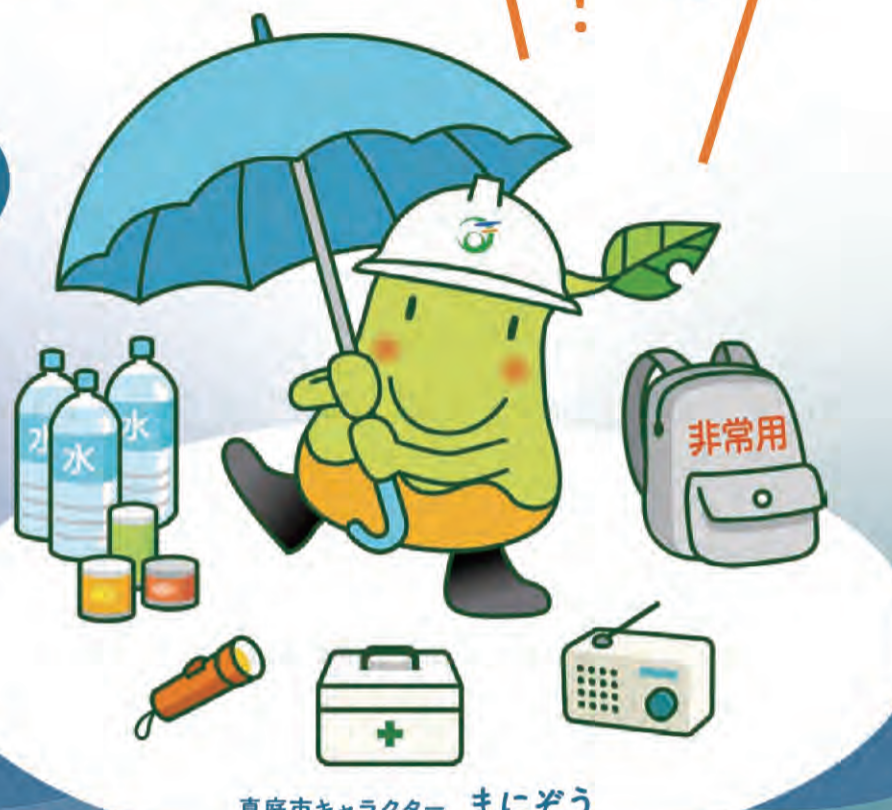
真庭市キャラクター まにぞう