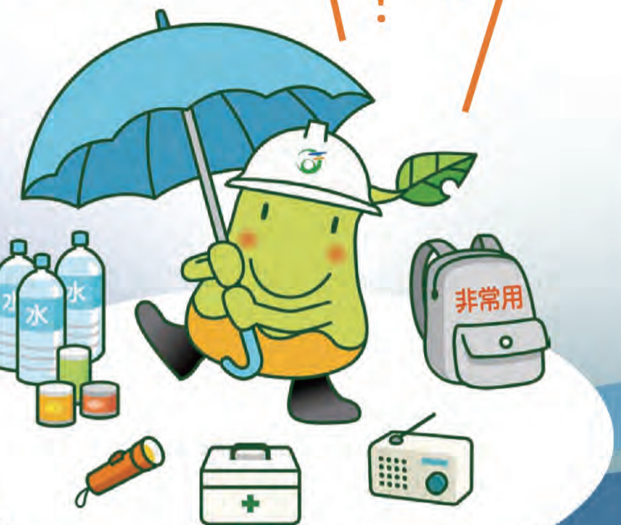
真庭市キャラクター まにぞう