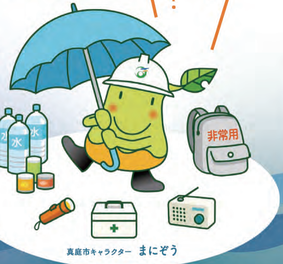
真庭市キャラクター まにぞう