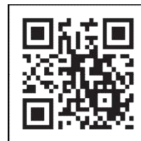
「コロナワクチンナビ」 二次元コード