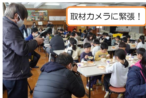
取材カメラに緊張！