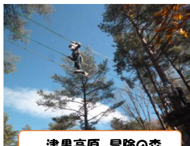
津黒高原 冒険の森

6年生の子供たちは、修学旅行の醍醐味である友達と宿泊することや、真庭北部地域の観光地をしっかりと楽しむことができました。それぞれの観光地での子供たちの姿や、時間を守って行動する姿から、「真庭のよさを見つけること、6年間の小学校生活で学んできたことを修学旅行の中で生かすこと」の修学旅行の目的を達成してくれたと思います。なによりも様々な活動が自粛されている中で、6年生の子供たちに楽しい思い出ができたことを心からうれしく感じています。