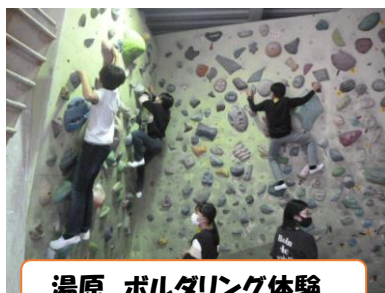
湯原 ボルダリング体験