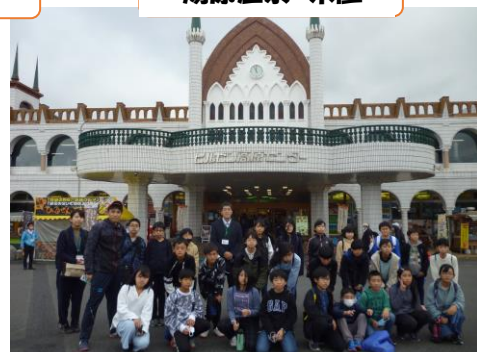
蒜山高原センター