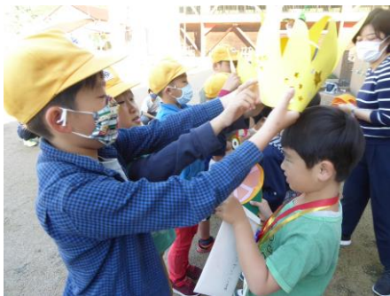
< 1年生を迎える会 >

自分が子どもの頃を思い起こしてみると、パソコンも携帯電話もありませんでした。今の生活の中で当たり前になっていることが、当時は想像すらできませんでした。今を生きる子ども達が、社会の主力となって活躍する20年、30年後は、いったいどんな社会になっているのでしょうか。