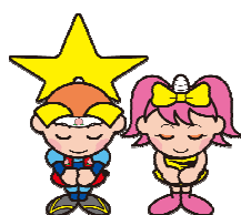
岡山県マスコット ももっち・うらっち