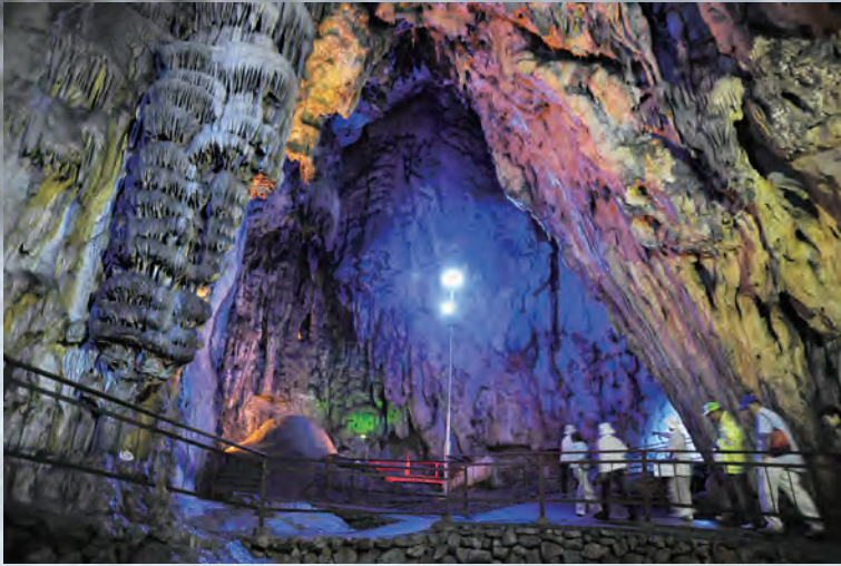
鐘乳穴の内部は幻想的な雰囲気広がる