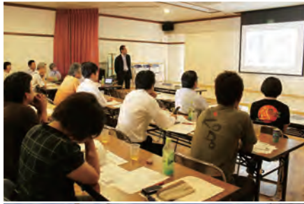
7月7日、新マークデザインの説明会が行われ、熱心に聴く参加者