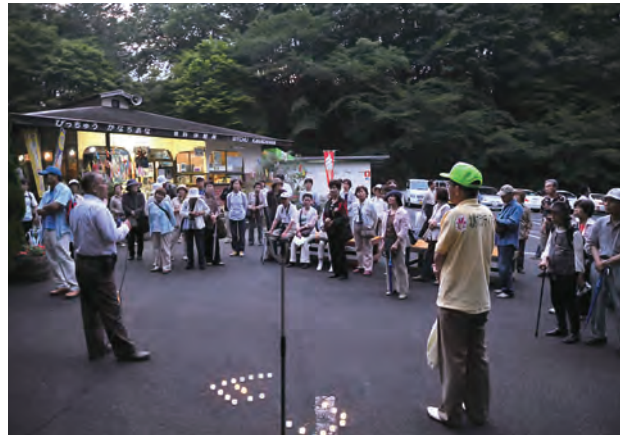
鐘乳穴やヒメボタルの説明に聴き入るツアー参加者

真庭観光連盟の体験ツアーが人気を集めています。地域に密着した地元観光連盟だからできるツアーは、地域の人たちの協力で、どれもひと味違った真庭の魅力満載です。7月7日の「北房ヒメボタル観賞ツアー」には、岡山市などから定員いっぱい43人が参加。貸切の鐘乳穴で、初めて見るヒメボタルに感動していました。観光連盟のツアーは、今後ともめじろ押し。ホームページで「真庭人」をチェックしてみてください。