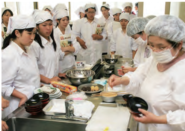
講師の手際の良さに見入る高校生

7月9日、久世高校で「真庭の味」伝承料理教室が開催され、家政科の29人が郷土料理の作り方を学びました。真庭地域食育推進協議会の募集に、同校が笹すし・お月見団子・汁物を作りたいと申し込んで実現した今回の教室。参加した1年生にとつては、高校入学後初めての本格的な調理実習とあつて、真庭栄養改善協議会久世支部所属の講師の指導や先生のアドバイスを真剣に見聞きし、ふるさとの味を引き継ぎました。