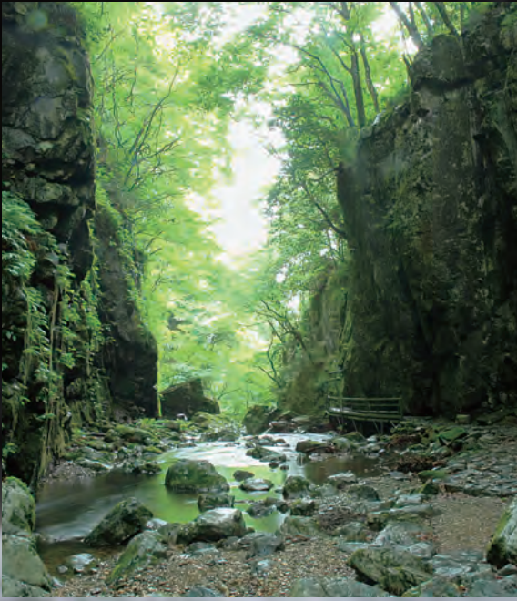
木々に覆われた渓谷内を山乗川が流れる