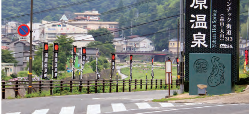
イメージを一新して目を引く湯原温泉街入り口に設置された看板