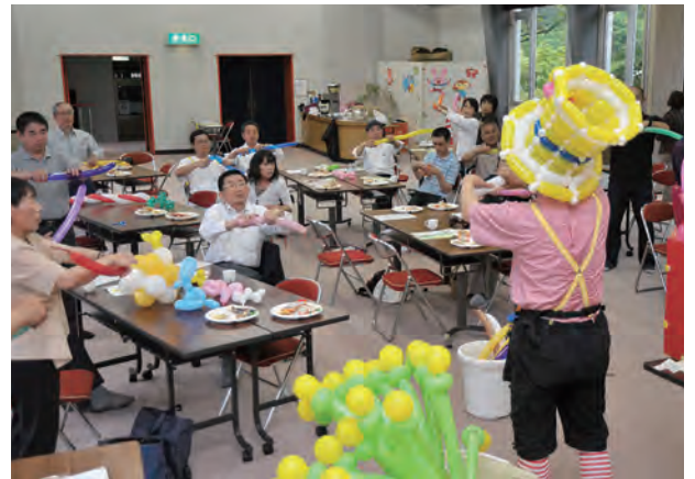
風船おじさん(勝山在住)の指導でバルーンアートを体験