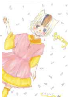
▲ PN さすらいの小6女子