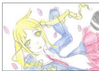
▲ PN モトーン羊

師と看護師のチームワークの素晴らしさ、高度な医療技術、患者や付添人に対する親切で丁寧な心遣いなど、私は手術に携わった皆さんに心から感謝をしました。身内は体力的にも衰弱していましたが、長時間の手術に一生懸命耐えています。現在は個室に移り、療養に専念しています。1日も早く回復し、笑顔で元気に退院できる日を心から待ち望んでいます。