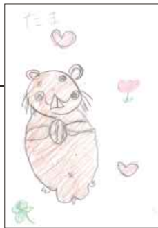
▲ PN あおい