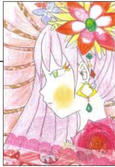
▲ PN マコト