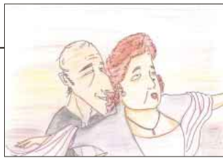
▲ PN はな王子