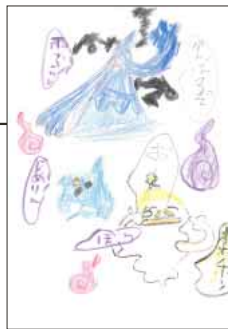
▲ PN 妖怪ゴッコ