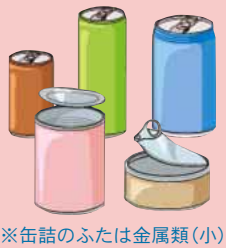
※缶詰のふたは金属類(小)