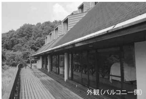
外観(バルコニー側)