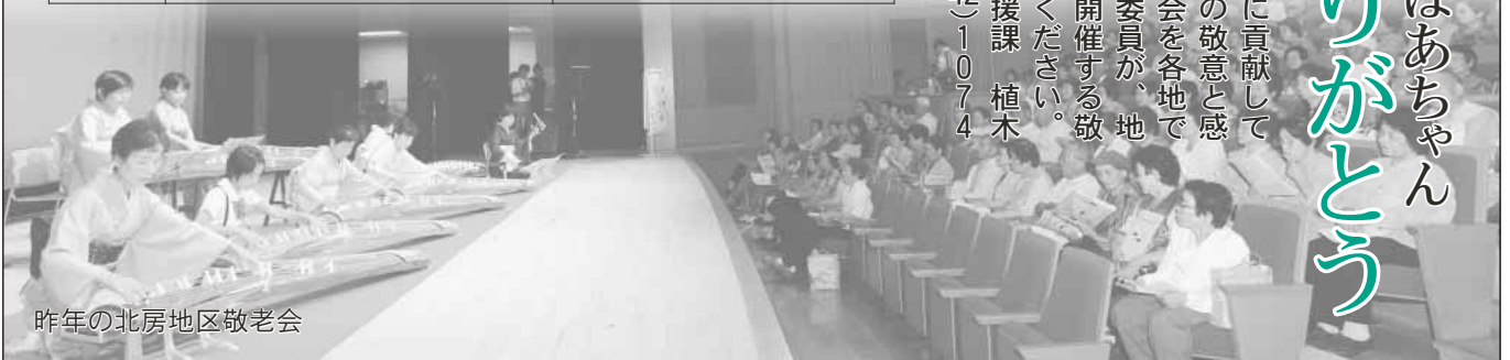
昨年の北房地区敬老会