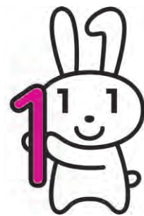
マイナンバー 広報キャラクター マイナちゃん