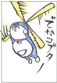
▲ PN テストステロン