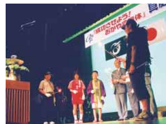
各実行委員会で採火した火を合火

7月26日、晴れの国おかやま国体真庭市総決起集会が久世エスパホールで行われました。