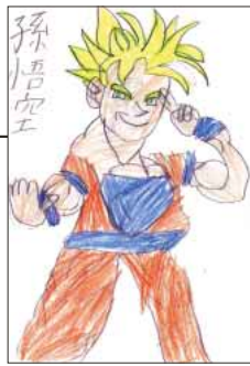
▲ PN 孫悟空