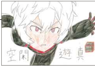
▲ PNワールドトリガー