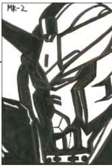
▲ PN こう