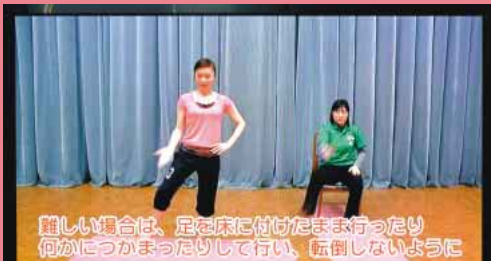
難しい場合は、足を床に付けたまま行ったり何かにつかまったりして行い、転倒しないように

真庭いきいきテレビ サブチャンネル 毎日 10:00 14:00 20:00 放送中!