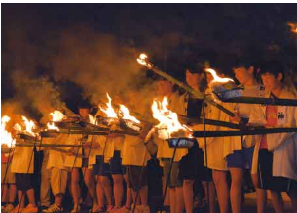
油団子に点火する児童たち

7月18日、上水田の郡神社で火まつりが行われました。害虫を駆除するために田んぼの周りで火をたいて豊作を祈願していたのが由来。年男・年女の上水田小6年生21人が境内を歩いて3周した後、参道を抜け田んぼに移動。古綿に重油を染みこませた「油団子」に点火しました。児童の儀式を合図に、氏子でつくる「郷親会」のメンバーが、神社周辺の道路沿いに並べた約800個の油団子に次々と火をともしました。