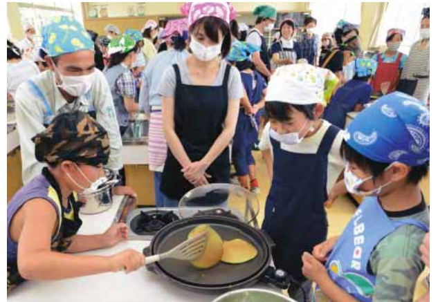
フライ返しでパンケーキを慎重に返す児童