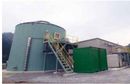
実証プラント全景