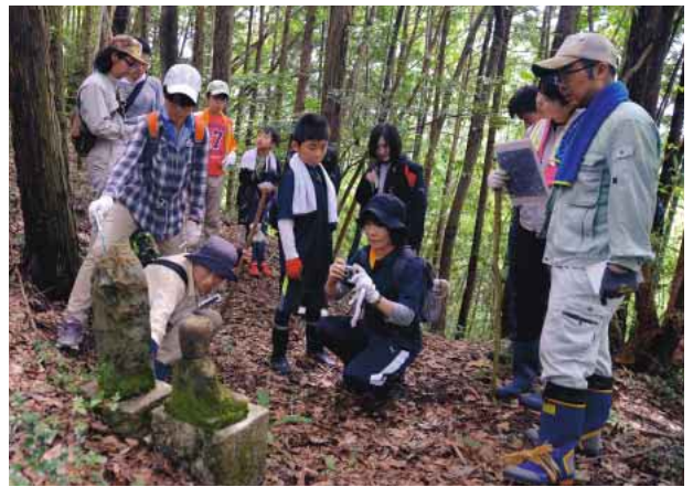
お地蔵様を見つけ調査をする参加者