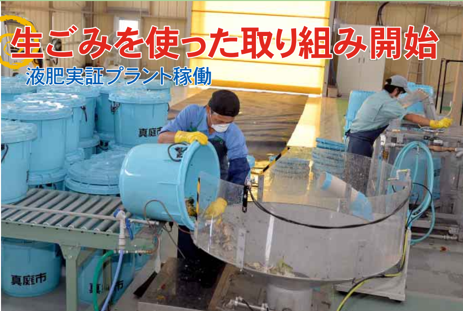
中に不要なものが入っていないか確認しながら機械に入れる作業員