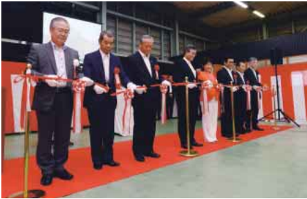
完成式典のテープカット