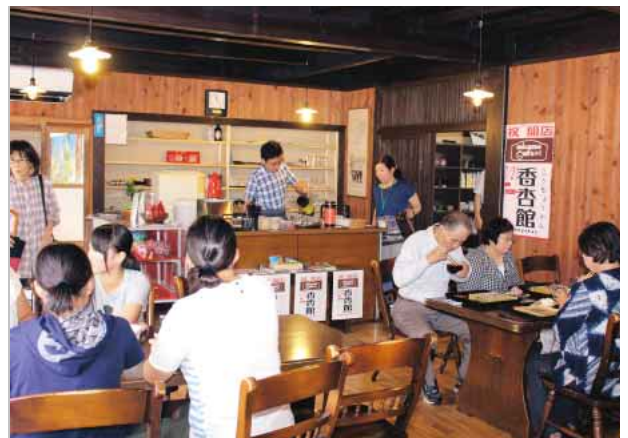
オープン初日にぎわう店内

7月19日、落合小学校裏のしめ山で、しめ山冒険ツアーが開催され、地域住民と真庭高校落合校地の生徒約50人が参加しました。今回は、江戸時代後期に設置されたといわれる八十八体のお地蔵様の調査と、未開発のルート整備を実施。参加者は5つの班に分かれ、3つの班がお地蔵様が設置されている緯度と経度を図り地図に落とす作業、2つの班が未開発の道を探索しながら、邪魔になる木の除去などを行いました。