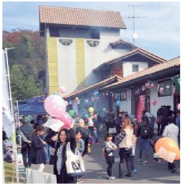
晴天のもと、旧上田小学校にたくさんの方が集まりました。

問 交流定住センター：0867-44-1031 交流定住推進課：0867-42-1179