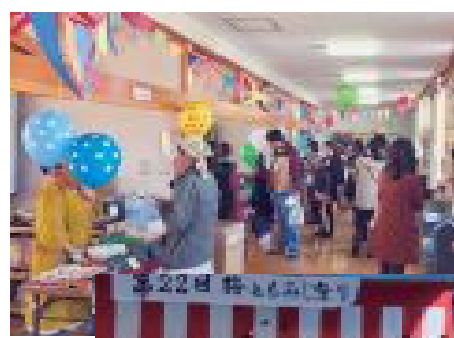
出店は地域と国境を越えたグ ローバルな内容となりました