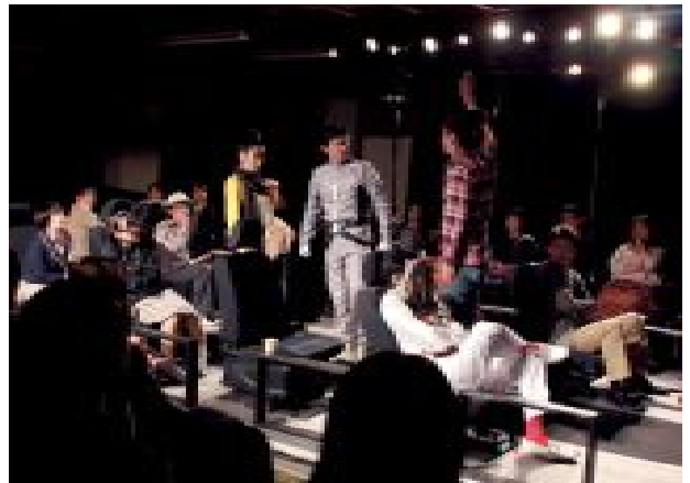
舞台と客席のすぐ近くで繰り広げられた演劇

11月5日、蒜山ホースパークで乗馬教室が開かれ、子どもたちが馬とのふれあいを楽しみました。真庭市内5つのライオンズクラブの合同事業として毎年開催され、今回で10回目。この日は親子79人が参加しました。リオデジャネイロ五輪に出場した原田喜市さんの模範演技を見学した後に乗馬を体験。はじめは恐る恐る乗っていた子どもたちでしたが、慣れてくると「かわいい」「楽しかった!」と笑顔を見せていました。