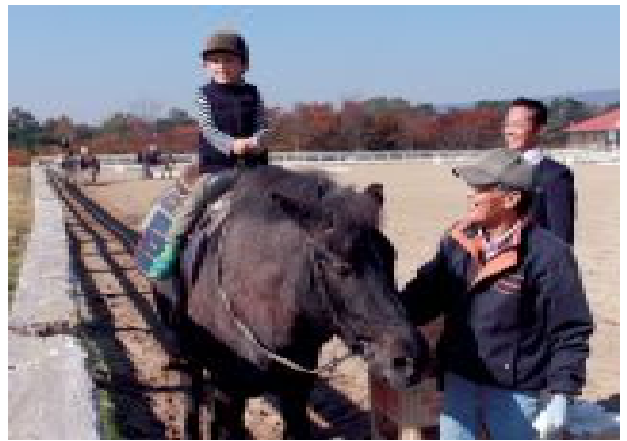
笑顔で乗馬体験を楽しむ子どもたち