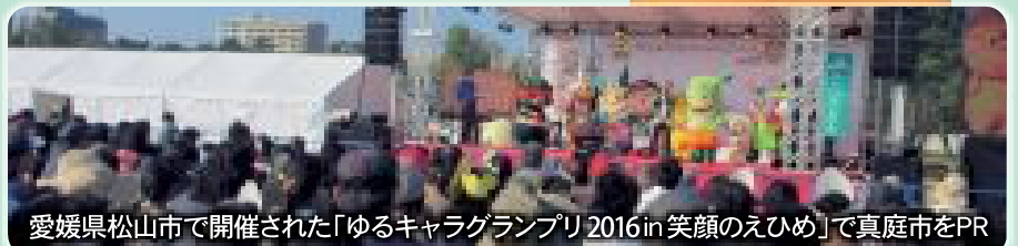
愛媛県松山市で開催された「ゆるキャラグランプリ2016 in 笑顔のえひめ」で真庭市をPR