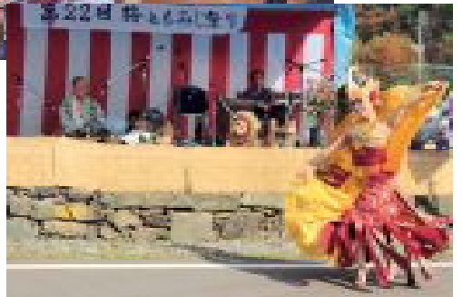
県民文化祭と連動し国際色豊かなパフォーマンスが行われました