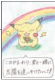
▲ PN チータロ