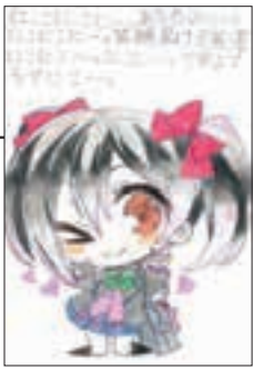
▲ PN リク