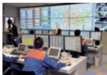
共同運用が始まった指令センター

真庭、津山圏域、美作市の消防本部が通信指令業務を共同運用する「美作地区消防指令センター」の運用開始式が、3月29日に津山圏域消防組合本部で行われました。それまで3消防本部それぞれで受けていた119番通報を同センターに一元化。10市町村約24万人が住む圏域をカバーするようにになりました。