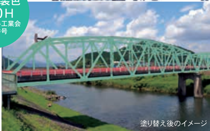
塗り替え後のイメージ