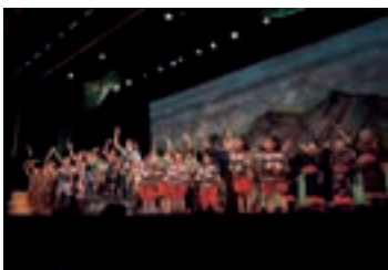
キャスト勢ぞろいのフィナーレ

真庭の歴史を題材にした「まにわっミュージカル」が3月16日、勝山文化センターで上演されました。美作国建国1300年記念事業として行われたもので、公募で集まった176歳の出演者と制作