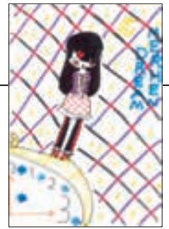
▲ PN ルナドリーム☆