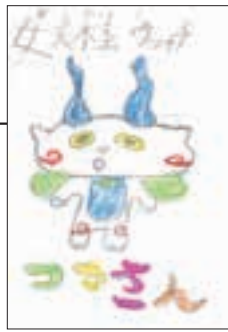
▲ PN アルファ