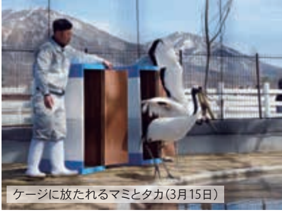
ケージに放たれるマミとタカ(3月15日)

蒜山タンチヨウの里オープンに先立つ3月15日、和気町にある県自然保護センターからタンチヨウが真庭にやってきました。タンチ