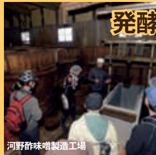
河野酢味噌製造工場