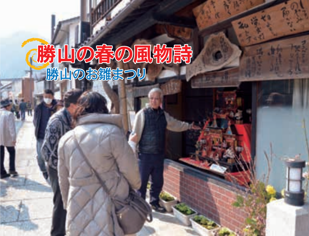
飾られた雛人形の説明を受ける観光客