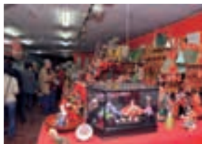
多くの雛人形が飾られた商店