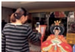
お雛さまになってハイチーズ