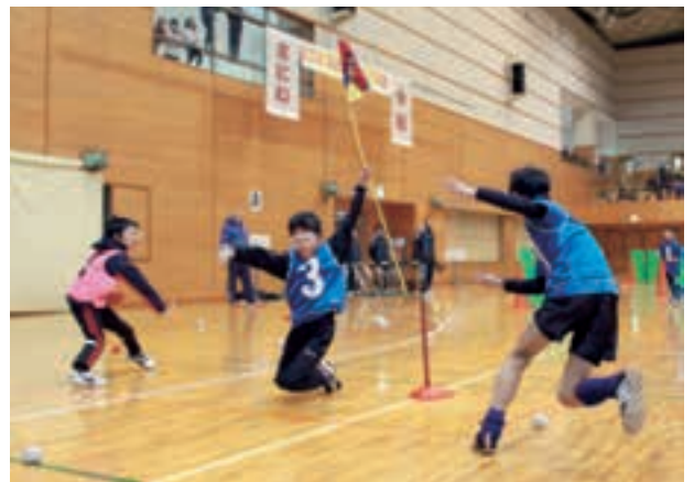
敵陣の旗を狙って熱戦を繰り広げる参加者たち