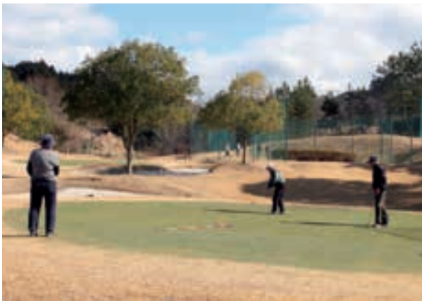
青空の下ゴルフを楽しむ参加者

3月12日、北房英賀公園ミニゴルフ場でチャリティゴルフコンペが開かれ、市内から21人が参加しました。参加者は、距離が短く正確なショットが要求されるミニゴルフ場ならではの醍醐味を満喫しながら、青空の下でプレーを楽しみました。このコンペは、公園内の緑化のために、参加費の一部が松などの苗木の購入費に充てられ、3月15日には上水田幼稚園の園児たちが丁寧に植樹をしました。