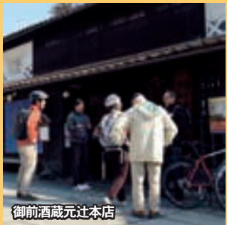
御前酒蔵元辻本店