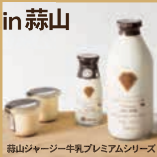
蒜山ジャージー牛乳プレミアムシリーズ

蒜山高原でチーズ作りをしている工房やカフェを訪ねたり、山葡萄のワインを作っているワイナリーを巡ったりします。