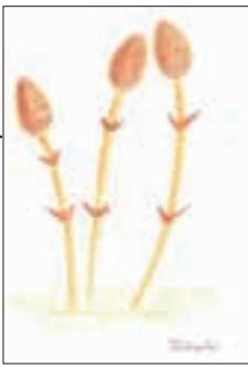
▲ PN つくし