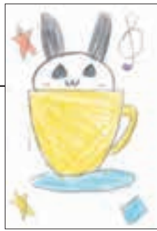
▲ PN カコ