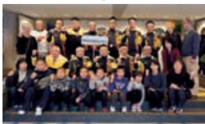
月田金太郎クラブ