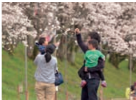
桜と触れ合う親子

を植えました。冬の間は雪で折れたりもしましたが、植えるに誰となく草を刈ったり側の木の枝を切ったり支えたりと満開の桜を思いながら手入れをしました。苗木の植えられた土手の下の川は、春は雪解けと同時にひらめの解禁。夏には蛍が飛び、かじか蛙が鳴き、子どもたちの川遊びの場。秋にはサンショウウオの産卵と豊かな川です。今は1メートルあるかないかの桜の苗木。川を彩るにはまだまだかかると思いますが、春が楽しみになる桜になってほしいと思います。