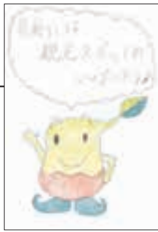
▲ PN チータロ