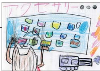
▲ PN こはる