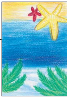
▲ PN ちい