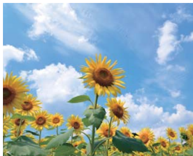
蒜山高原を彩るヒマワリ

私は小学4年生の時、授業後に残って女の先生から書道の手ほどきを受けました。終戦があつたり、進学があつたり大人になるまで筆を持つことから遠ざかっていました。そして、子育てが終わった頃、通信教育で東洋書道学会の会員になり、月2回、添削指導で勉強しました。東京の日本青年館へ直接指導を受けにも行きました。その時の私はやる気充分でしたから、2級をいただきました。その頃、42才でした。その後、諸々の忙しさに追われて毛筆とは離れました。自分では、その2年間ぐらいが全力で頑張っていたかな、と思っています。