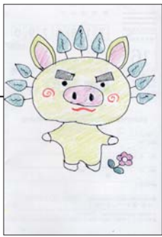
▲ PN もりたみきえ