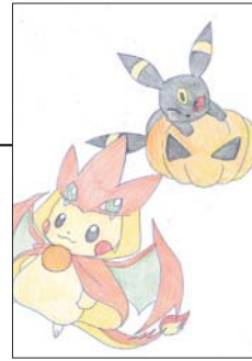
▲ PN チータロ