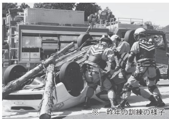
※一昨年の訓練の様子