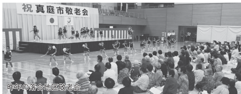
昨年の落合地区敬老会

おじいちゃんおばあちゃん いつもありがとうございます 長年にわたり、地域の発展に貢献してこられた75歳以上の方々への敬意と感謝を表し、長寿を祝う敬老会を各地域で開催します。各地区の実行委員会が、地域の皆さんと力を合わせて開催する敬老会をお楽しみください。