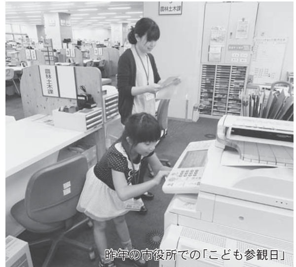
昨年の市役所での「こども参観日」