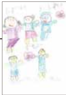
▲ PN いちか