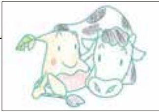
▲ PN あさみつ