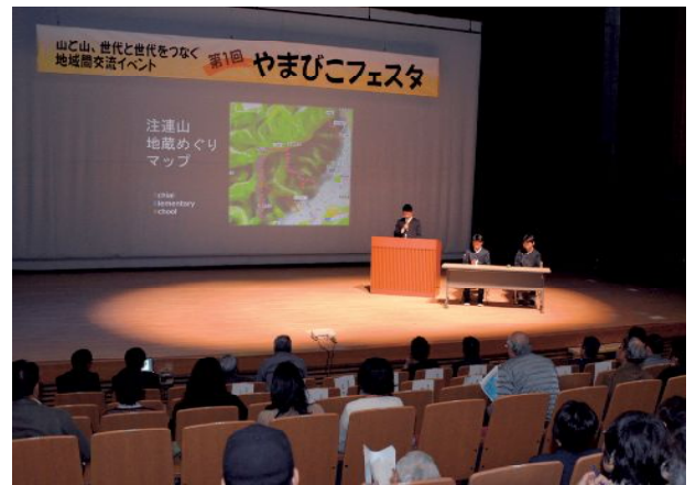
活動発表を行う落合小学校の児童たち