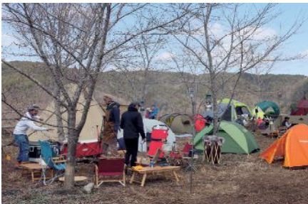
本格的なキャンプでイベントを満喫