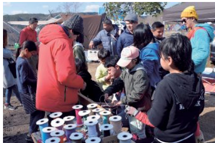
体験コーナーも充実!