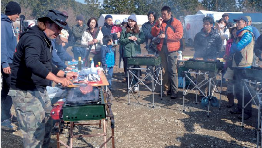
アウトドアには欠かせないバーベキューの調理法を学ぶ