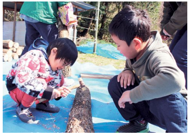
秋には美味しいなめこが収穫できるよ