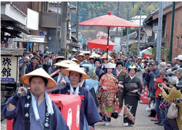
優雅な輿入れ道中に誰もが魅了されました

3月25日と26日の2日間、下中津井にある中津井陣屋周辺で16回目となる「中津井雛の文化まつり」が開かれ、通りに並ぶ民家や寺など約40軒に雛人形が飾られました。中津井雛の文化まつり最大の見どころ、江戸時代末期の嫁入りを再現した輿入れ道中では、大勢の見物客がカメラを構え、優雅な時代絵巻を収めていました。まつりは地域の有志でつくる中津井やまびこ会が、地域活性化を目的として毎年開催しています。