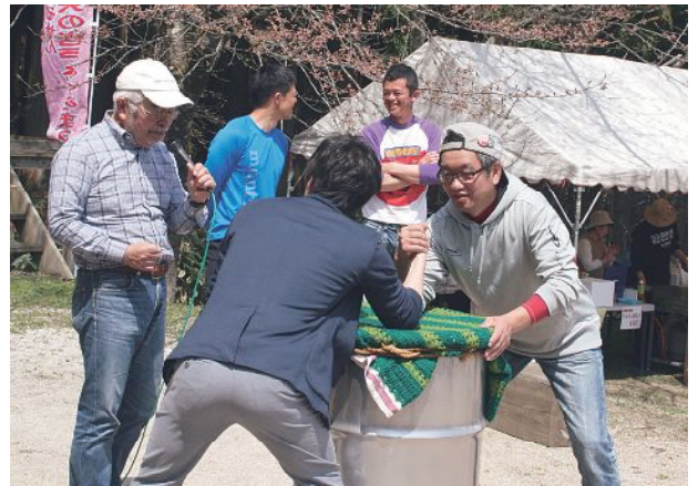
毎年恒例の腕相撲大会。勝つのはどっち?

4月2日、三阪のやまびこスタジアムの北側にある炭焼き窯周辺でしいたけとなめこの植菌体験が行われ、市内外から約20人が参加。この体験イベントは三阪地区の里山を守ろうと有志でつくる「みやまの会」が企画しました。参加者は槌を使ってクヌギの原木にしいたけの駒を、サクラの原木になめこの駒を打ちました。中には原木を持ち帰り、自宅で栽培に挑戦すると意気込む参加者の姿も見られました。