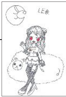
▲ PN レオ