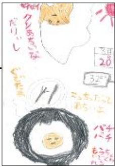
▲ PN かしのおちゃこ