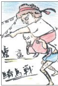
▲ PN はな王子