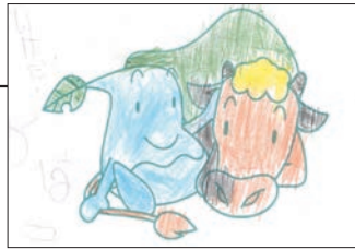
▲ PN いけだかーこ