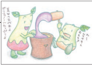
▲ PN みじんこDX