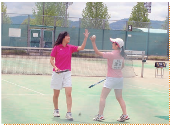
ソフトテニス部美作総体で活躍

少人数のため部活動も制限されているのでは？と思われるが、蒜山校地ですが、毎年、生徒がやりたい部活動を申請し、作る事ができます。昨年度はスキー部、ソフトテニス部、蒜山ABC部、バスケットボール同好会、バレーボール同好会、軟式野球同好会がありました。どの部も一生懸命活動しています。蒜山ABC部が毎月発行する「ひるこうタイムズ」で、私たちの活動をぜひご覧ください！