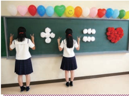
フотスポットで撮影した写真(展示)