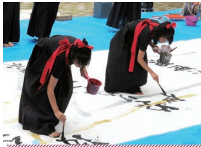
書道パフォーマンスの様子

毎年9月のはじめに、鼓山祭という学校祭をしています。赤団・青団・黄団の3つの団に分かれ、文化の部では舞台のダンス・劇、お化け屋敷やフォトスポットなどの展示をし、体育の部では応援・競技によって優勝を争います。中でも大盛り上がりなのが、体育の部の応援です。大きな声で歌ったり、エールを送って団全員が一丸となります。最高にアツい瞬間です。また、有志のバンドやダンス、吹奏楽部・書道部・美術部のパフォーマンスもあります。鼓山祭こそ、The青春!