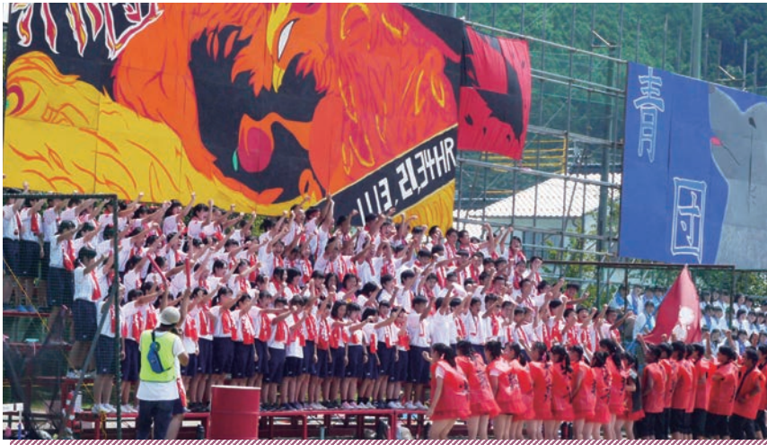
体育祭での応援(赤団)の様子