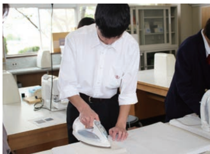
ファッションデザイン基礎の実習の様子