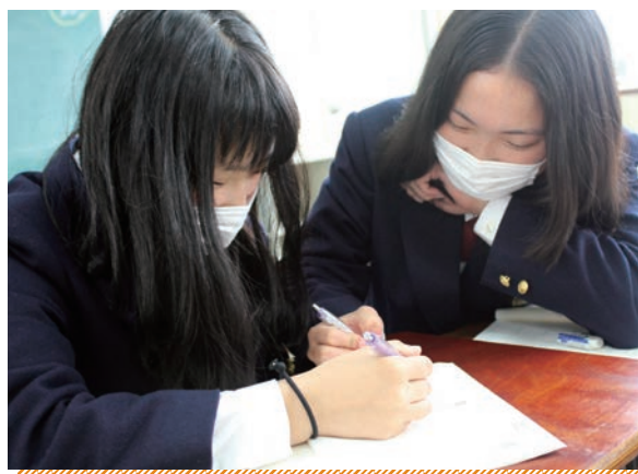
地域の現状を多面的に分析する