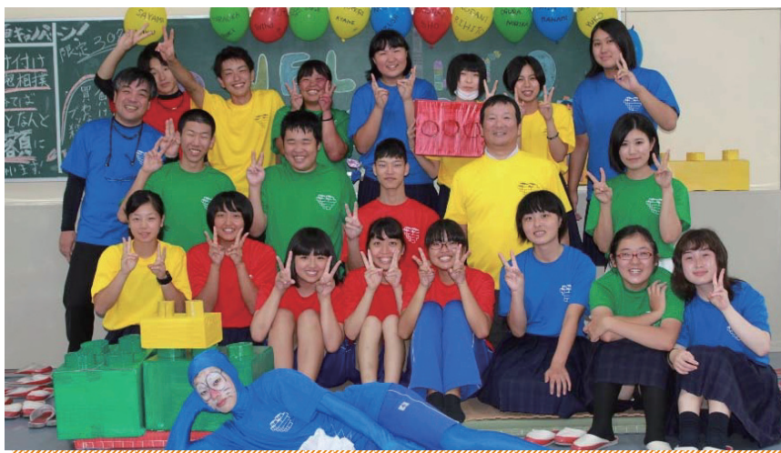
全校生徒が一致団結。とても楽しい三座祭(文化の部・体育の部)

蒜山校地は今年、創立70周年を迎えます。校地歌（＝蒜山高校校歌）の「高校たてり野にたてり」のフレーズは、地元の願いで作られた学校の証であり誇りです。地域で活躍できる人材を養成するために、普通科でありながら「商業科目」と「家庭科目」が充実しています。昨年度は全校生徒53名が静かな環境で学びました。少ない人数で落ち着いて学びたい人、一度蒜山校地を訪れてみてください。