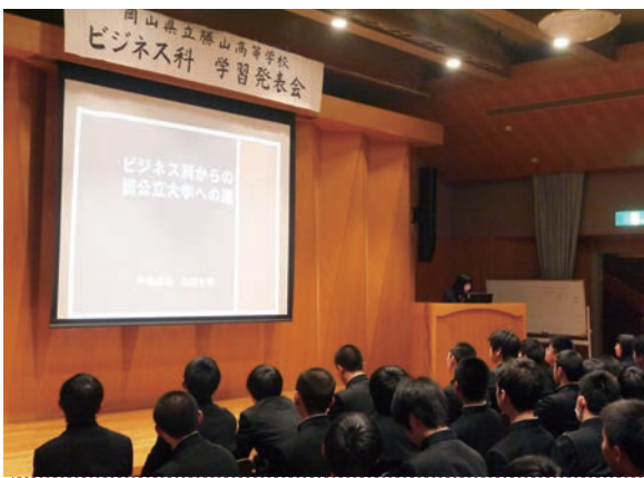
3年生が進学報告をしている様子

普通科では、総合的な学習の時間『夢現(むげん)プロジェクト』で、「感じて、考える、そして動き出す」をテーマに、自分が興味のある分野について研究をしています。昨年度は「岡山県北部における地域教育共創」(2年教育コース)や「BDF流行について」(1年理工コース)など、地域をテーマにした研究もいくつか取り上げられ、勝高生自らが、率先して活動に取り組みました。