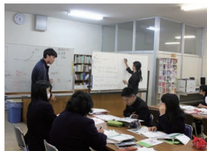
英語の授業の様子