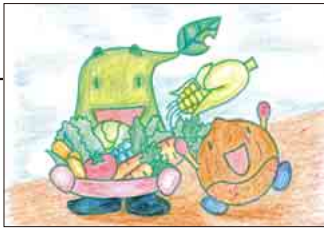
▲ PN 昭和生まれの青年さん