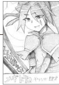
▲ PN 落書きの人さん