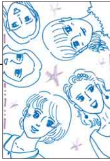
▲ PN 紫さん