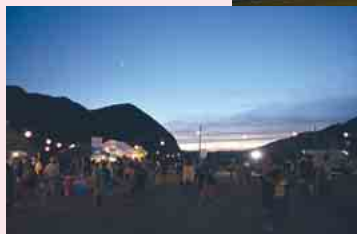
8月14日、久世バーサイドフェスの日の久世河川公園の様子

Hello! This summer has been hot, hasn't it! I hope everyone is well? The U.K., too, has apparently been hot this year, but as it lacks humidity unlike Japan, I don't think the heat is as bad back home. But besides from the heat, if you think of Japanese summer, it has to be festivals! I love how everyone celebrates together, eating and drinking and watching fireworks and getting excited. We don't really have events like this back home, so I hope to enjoy as much of Japan's as I can, even in the heat!