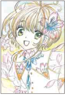
▲ PN budouさん