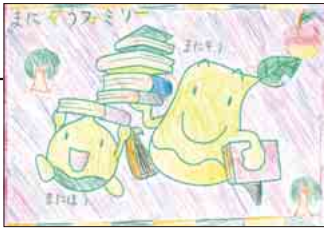
▲ PN るるさん