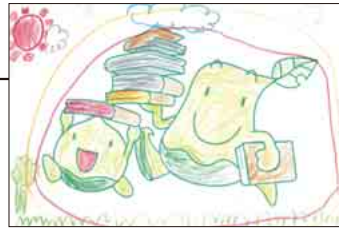
▲ PN ゆーまさん