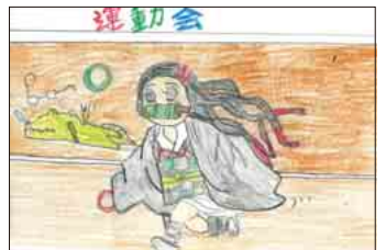
▲ PN しば(犬)さん

お見合いで仲人さんは、我が夫を「好い男」「まじめな公務員」「多分百万円は貯めている」と褒めたたえます。遠い親戚の人なのでつりがきもなく、お見合いまでまるで見当が付きません。「身長はどれくらい」「等と想像しても何のイメージも浮かばず当日を迎えました。今と違って細身で優しそうに見えて2・3回デートして婚約となり結婚準備に入りました。親は当てにしないと決めて、お互いの貯金を出し合おうとすると「僕は貯金もなければ借金もありません」と堂々と言われ啞然とし、タンヌもすべて月賦の新婚生活となりました。金婚式も終えた今日があるのはやはり「優しさ」でしょうか。