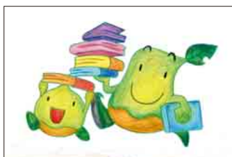
▲ PN ホットコーヒーさん