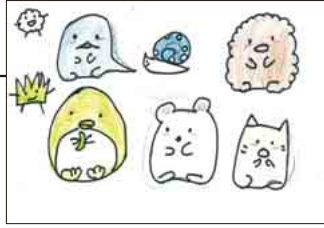
▲ PN すみっこさん