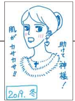
▲ PN MILK teaさん