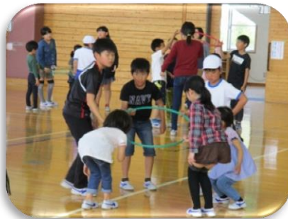
4月 縦割り遊び(昼休み)