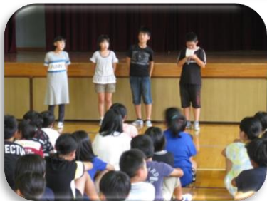
6月 フレンドリー集会 企画運営委員会が司会進行し、 全校が仲良くなる集会を行いました。