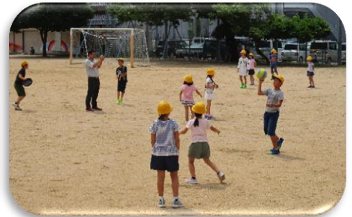
7月 縦割り遊び(業間)