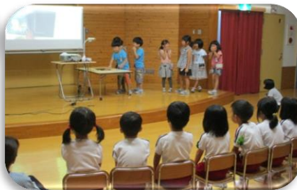
7月 1年生が幼稚園に出向いて 読み聞かせをしました。