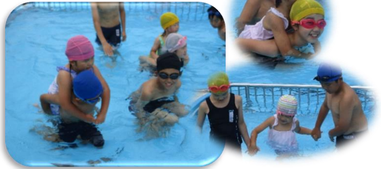
7月 幼稚園児と5年生交流プール