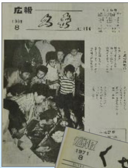
昭和40年代の「広報くせ」。土曜夜市が表紙を飾っています。